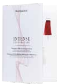
INTENSE COLOR Chart