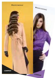
ROLL - UP