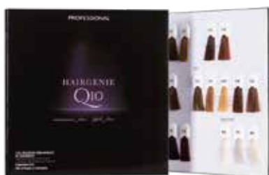
HAIRGENIE Q10 Chart