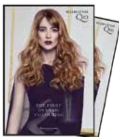
Poster HAIRGENIE Q10