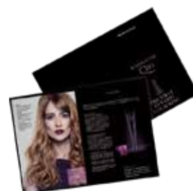
Depliant HAIRGENIE Q10