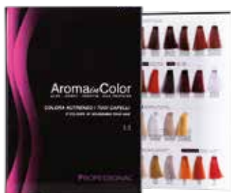
AROMA IN COLOR Chart