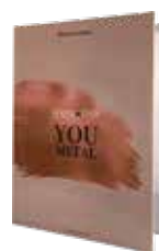
YOU METAL Chart