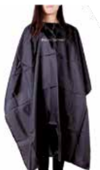
HAIR CUTTING CAPE