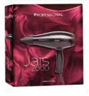
PHON JAIS 2000